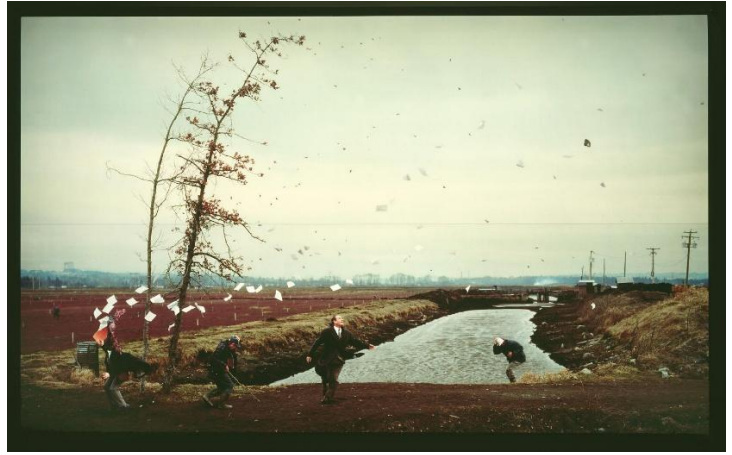
A sudden gust of wind (after Hokusai), Jeff WALL, 1993. caisson lumineux, 250 x 397 x 34 cm, Tate Gallery.