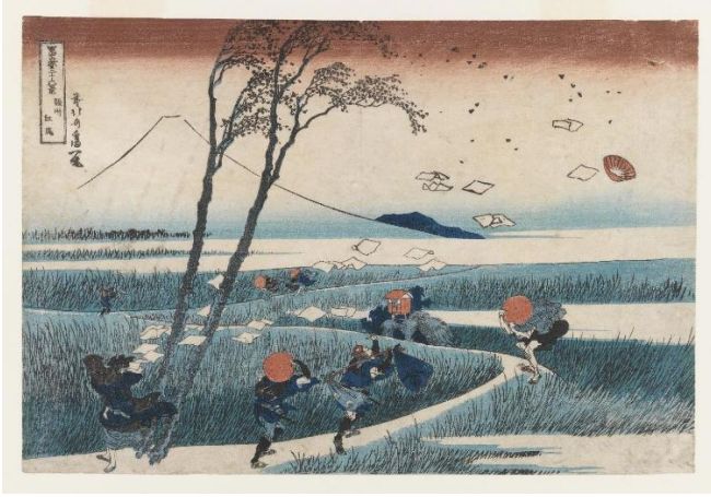
Yejiri Station, Province de Suruga, extrait de la série 36 vues du mont Fuji, Katsushika HOKUSAI, 1830, gravure sur bois, 25 x 37 cm, the MET.