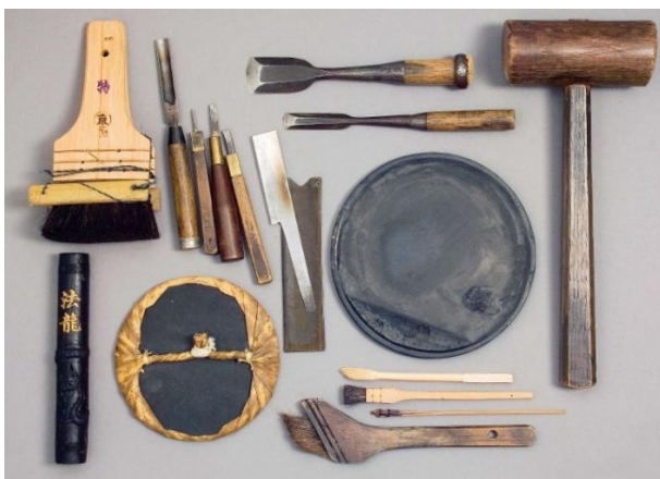
Outils utilisés au Japon pour graver sur bois et imprimer : baren à main, encre sumi et papier japonais washi